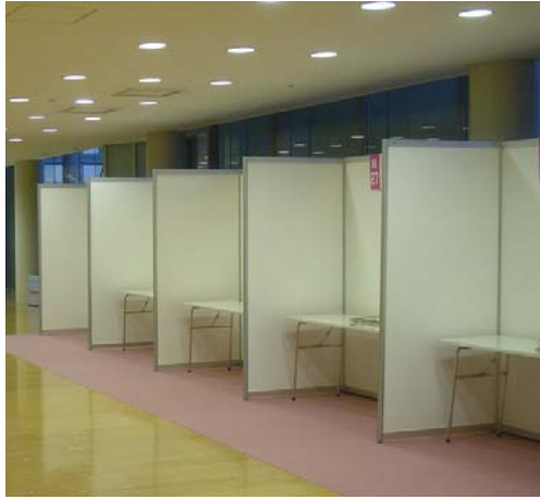
(a-1) ブース(標準 1 コマ:2m×2m 程度)